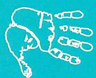
Illustration : Teo Manisier Mise en page : ADEA formations