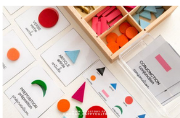
"Grammaire type Montessori"

Appel à candidature été 2021. Commission d'entretiens réalisés début octobre. Les AESH devaient avoir au moins 3 ans d'expérience (non CUI). Formation lors de la prise de poste.